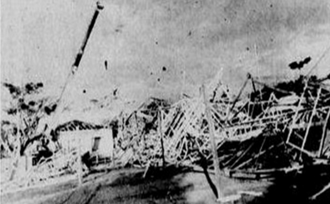
Imagem dos restos da Torre da Telepará após o colapso, com o guindaste visível no lado esquerdo.