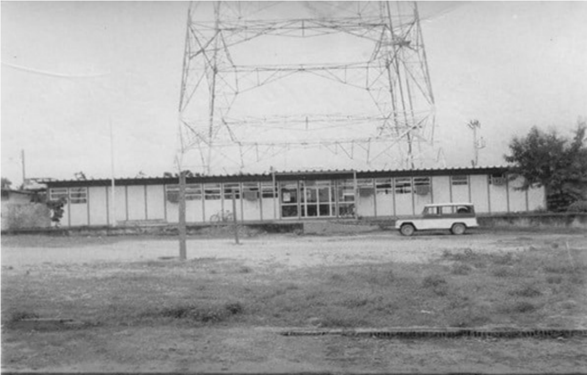
Imagem da Torre da Telepará em construção, com o veículo estacionado na frente do prédio.